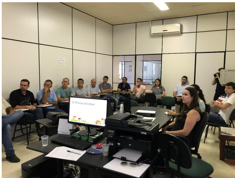
Foto 1: 1ª Reunião Técnica de Capacitação