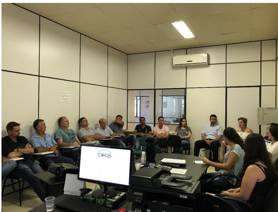
Foto 2: 1ª Reunião Técnica de Capacitação